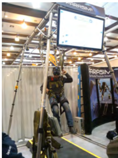
Veille technologique : le simulateur de vol sous voile

A l'effectif relativement restreint, le BEP ne demande qu'à se densifier afin de lui permettre de s'affirmer comme l'interlocuteur unique au niveau des armées pour le domaine TAP et de s'impliquer encore plus dans les différentes activités de la 11 e BP.