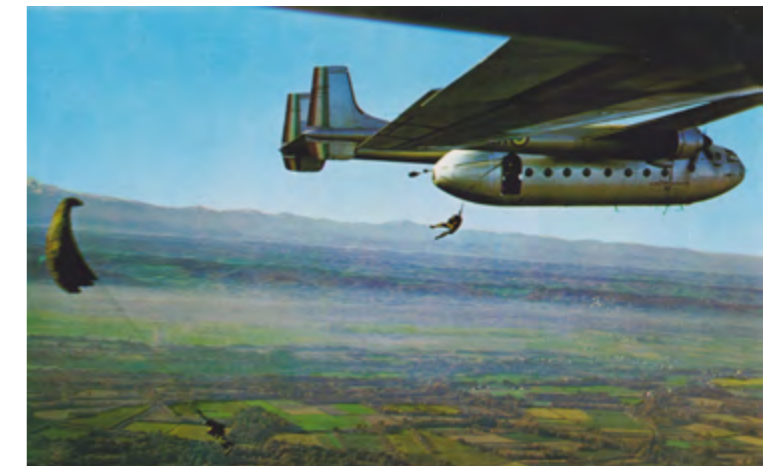
Un matin à Wright

Cérémonie Saint-Michel au camp Aspirant Zirnheld Commémoration des 70 ans de l'ETAP