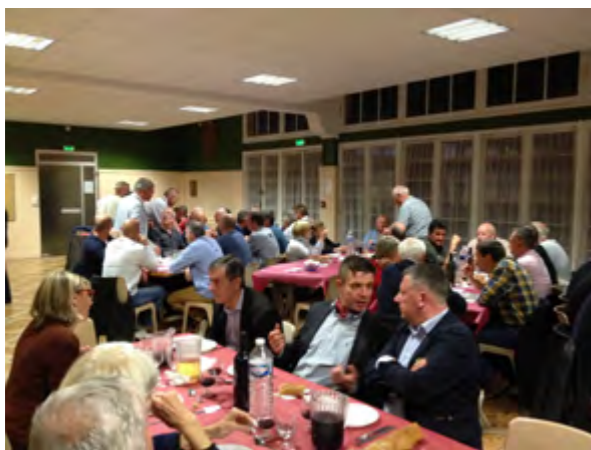
Une soirée conviviale

La veillée d'hier soir a été un succès, elle s'est déroulée dans une ambiance conviviale et décontractée. Cette soirée avait pour but d'accueillir nos adhérents les plus éloignés en présence de nos amis militaires d'active. »