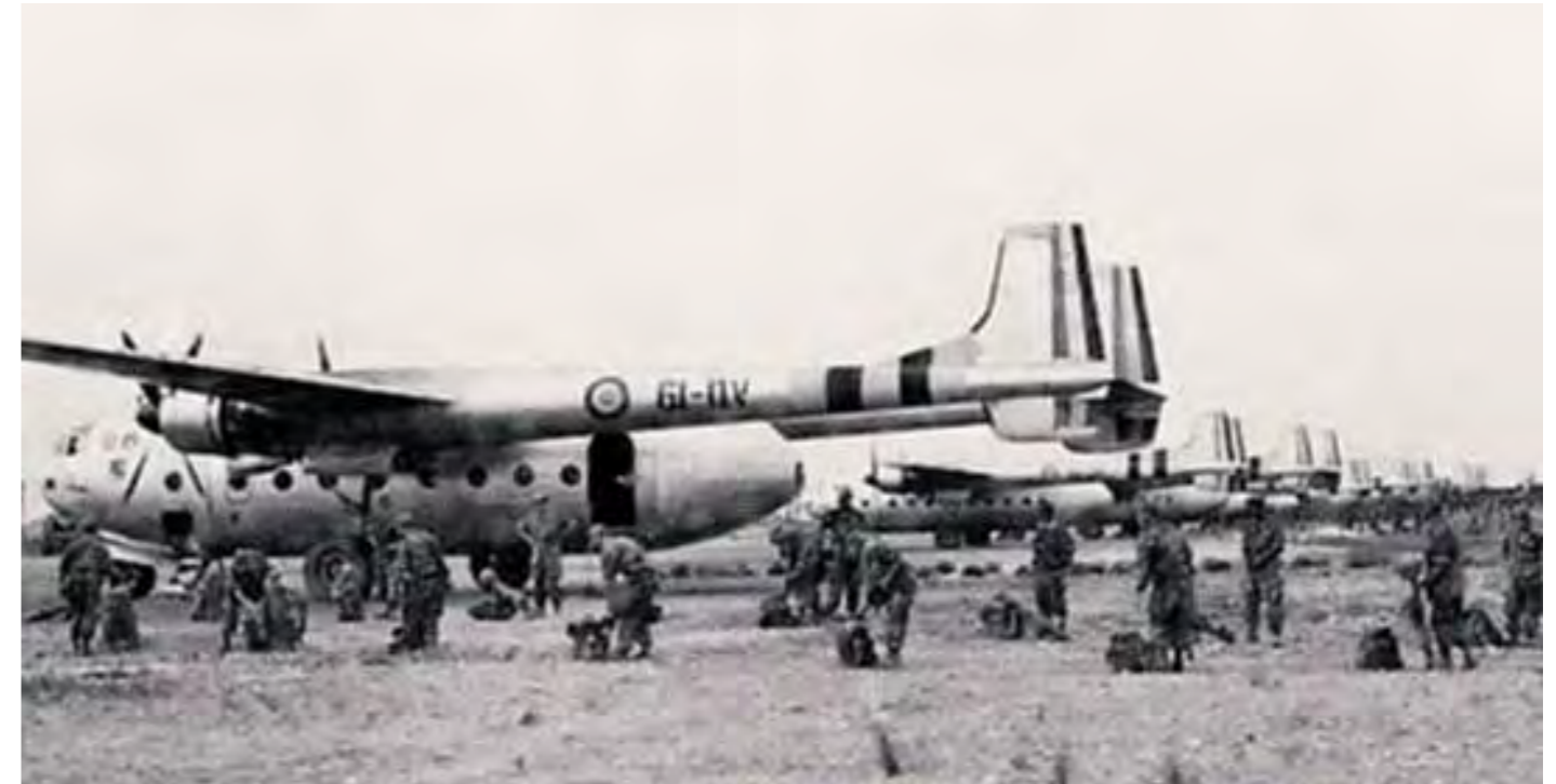
Départ pour l'«opération mousquetaire» - 5 novembre 1956