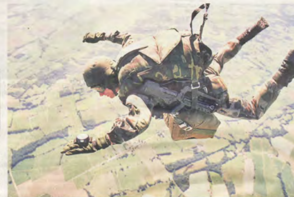
5 000 militaires, dont seulement 5 % de paras étrangers, seront formés cette année au sein de l'Etap.

« Cette école semble une bonne idée (...) La France est le seul pays à faire régulièrement sauter ses parachutistes » Jean-Dominique Merchet, spécialiste des questions de Défense