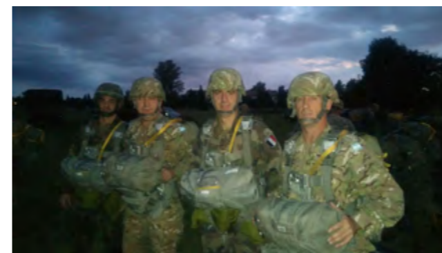
Embarquement à l'aube